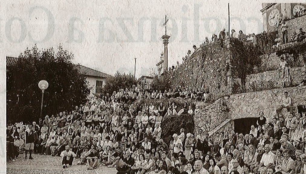
«Tra Sacro e Sacro Monte»: il pubblico di uno spettacolo. Sotto: un tratto della Via Sacra