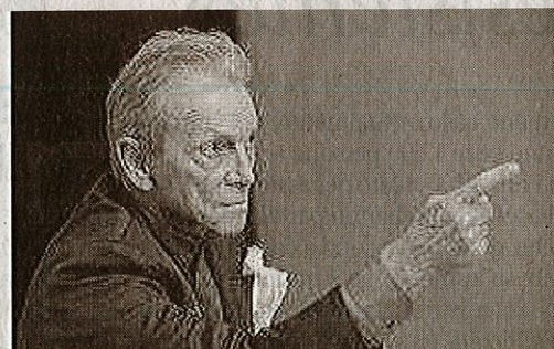
Umberto Orsini ne «Il grande inquisitore»

Gesù, sia centrale nel Corano e nella cultura islamica. Hugo von Hofmannstahl con Jedermann - Il dramma della morte del ricco nella versione che aprì il festival di Salisburgo arriva al Sacro Monte (mercoledì 19 luglio) grazie al Teatro Due di Parma per mettere a confronto l'uomo con la morte e la spiritualità. A chiudere la rassegna uno dei più amati comici italiani, Giacomo Poretti in Come nasce un'anima (giovedì 27 luglio). Il